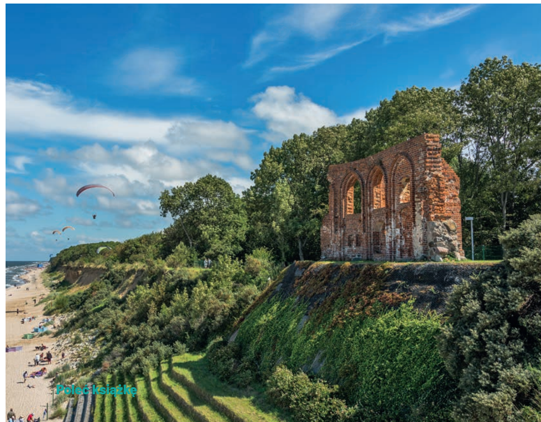
● Ruiny kościoła w Trzęsaczu

Kościół św. Mikołaja w Trzęsaczu powstał na przełomie XIV i XV w., i to w środku wsi, blisko 2 km od wybrzeża! To, że dziś podziwiamy tylko jedną ze ścian, wynika z procesów erozyjnych, konkretnie z abrazji. Polega ona na podmywaniu brzegów przez morskie fale – niewielkie fragmenty skalne niesione przez sztormy uderzają w wybrzeże, powodują jego niszczenie i tym samym tworzenie się klifu. 400 lat temu budowniczy świątyni nie mogli przewidzieć, że z upływem czasu ich miejscowość utraci tyle terenu – rokrocznie nawet 2 m. W 1750 r., kiedy morze niebezpiecznie zbliżyło się do świątyni, próbowano powstrzymać proces abrazji przez umacnianie klifu. Sztormy okazały się jednak znacznie silniejsze od ówczesnej techniki i proces wciąż postępował. W 1868 r. kościół znajdował się już tylko metr od przepaści. Ostatnie nabożeństwo zostało tu odprawione 2 III 1874 r., po czym świątynię zamknięto, a wyposażenie przeniesiono m.in. do katedry w Kamieniu Pomorskim. Kolejne fragmenty kościoła wpadały do morza w latach 1903, 1909, 1913, 1917, 1922, 1930, 1956, 1973 i 1994.